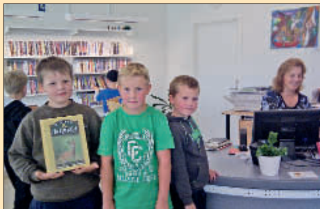
Fra kombinert skole- og folkebibliotek i Dønna kommune.