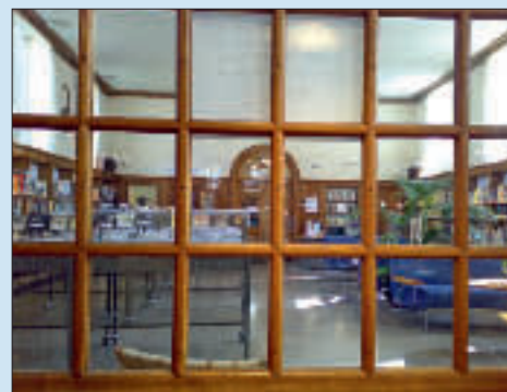
Inne på Fredrikstad bibliotek