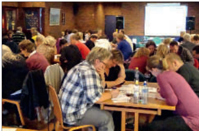
Fra en av quizkveldene i Vestre Toten.

Quizen holdes i foajeen på kulturhuset, hvor det også er åpen bar slik at det er muligheter for å kjøpe øl og vin for de som måtte ønske det. Biblioteket har inngang fra foajeen og holder åpent i tidsrommet quizen holdes. Biblioteket er veldig glade for å kunne ta i bruk fasiliteter utenfor biblioteket til arrangementer. To «hardbarkede» quizdeltagere, bl.a. fra NM, har tatt på seg jobben som quizmastere. De både lager spørsmålene og står for gjennomføringen av quizen. Resultater, spørsmål og fasit med statistikk legges ut på bibliotekets hjemmesider ( www.vestre-toten.folkebibl.no ) dagen etter quizen. Quizen startet opp igjen etter sommerferien 25. september.