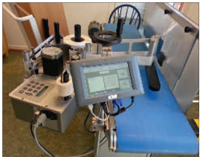
Brikkemaskinen «Knut» har vært til stor hjelp i arbeidet.

Allerede første åpningsdagen låste de første seg inn med lånekort og pin-kode. Trafikken har ikke vært overveldende de første 2 ukene, men med enda mer markedsføring og høsten i møte, har vi tro på økning i både besøkstall og utlån i Stavern.