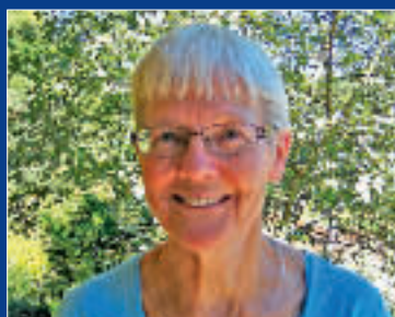
Bibliofil startet i Larvik bibliotek. Side 3.