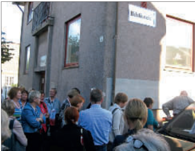
På Bibliotek-Systemers Biblioteksjefmøte, som nylig ble avholdt i Larvik, var et besøk i Stavern en del av programmet.

Planleggingen av dette prosjektet har gått med hurtigtogsfart, med oppstart i slutten av mai og igangsetting 2. september.