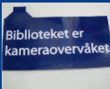
Døgnbiblioteket. Side 4 og 5