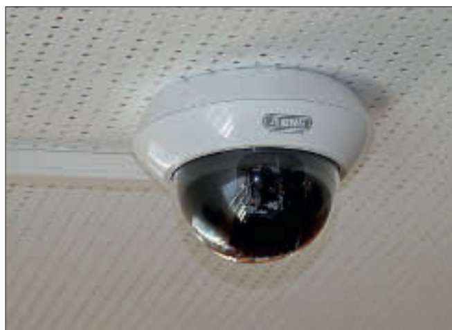
Det kan settes opp overvåkingskameraer som aktiveres ved bevegelse.

Det er biblioteket selv som bestemmer hvilke tjenester som skal være tilgjengelige i det døgnåpne biblioteket.