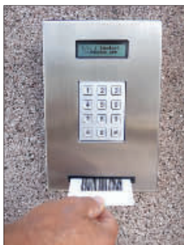
Logg inn med lånekort og pin-kode – og døren åpnes.

Det kreves at brukeren er registrert som låner i biblioteket for å kunne benytte Døgnbiblioteket. Har man nasjonalt lånekort må dette altså knyttes til det lokale biblioteket før man får tilgang. Innlogging skjer via innloggingspanelet ved ytterdøren, som styrer den automatiske dørlåsen. Biblioteksystemet har mulighet for at avvise lånere som ikke skal ha adgang til Døgnbiblioteket.